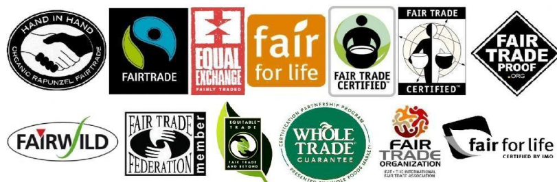
Gambar 2. Label Fair Trade produk kopi

Penerapan Fair Trade pada perkebunan kopi dapat dikenali melalui sertifikasi hasil produk dari suatu koperasi/perkebunan rakyat. Terdapat beberapa institusi/organisasi yang menerapkan mekanisme sertifikasi Fair Trade untuk kopi, antara lain Fairtrade Labeling Organization International (FLO), World Fair Trade Organization (WFTO), Network of European World Shops dan European Fair Trade Association (EFTA).